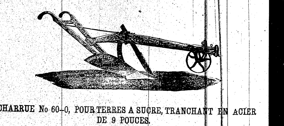
CHARRUE No 60-0, POUR TERRES À SUCRE, TRANCHANT EN ACIER DE 9 POUCES.

La réputation de ces charrues s'étend de plus en plus parmi les grands planteurs sucriers.