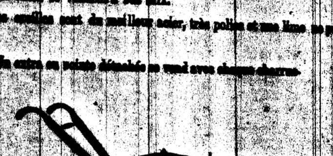
CHARRUE N. 90-0 POUR TERRES À SOUE, TRAHANT EN BOIS DE 12 POUCE.