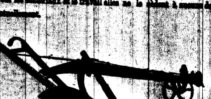
CHARRUE N. 80-0 POUR TERRES À SOUE, TRAHANT EN BOIS DE 11 POUCE.