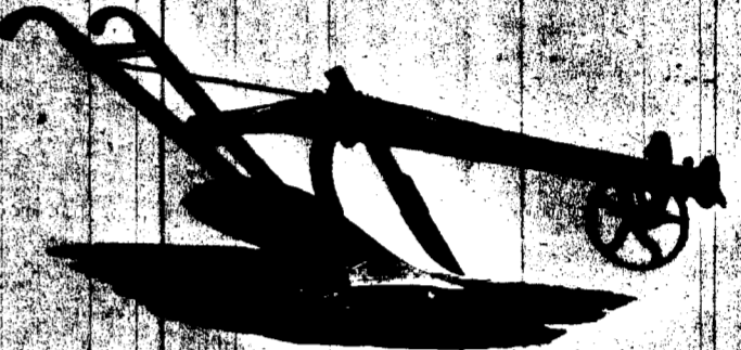
CHARRUE N. 70-0 POUR TERRES À SOUE, TRAHANT EN BOIS DE 10 POUCE.