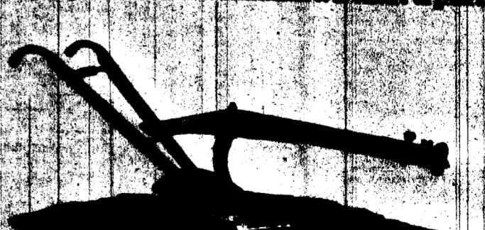
CHARRUE N. 0-0 TRAHANT EN BOIS DE 9 1/2 POUCE.