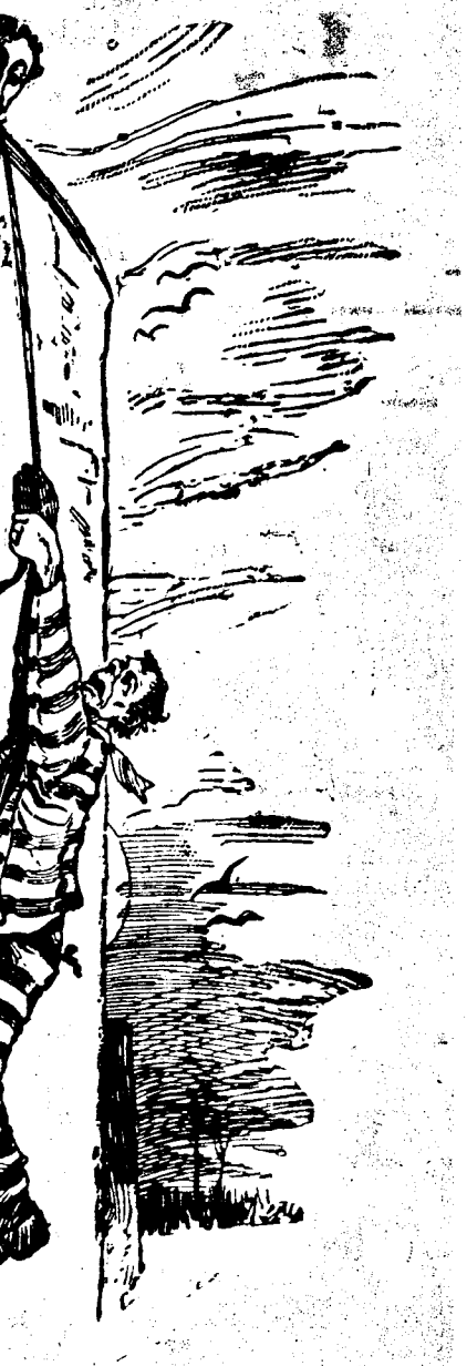
Le général Paiz, de l'armée du gouvernement.