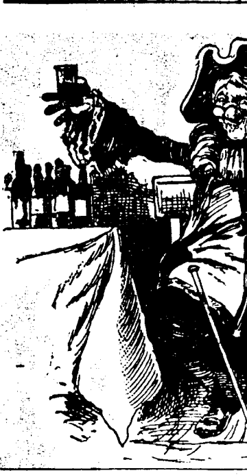
Le vieux Koikerbocker: "A la tienne, Raine!"