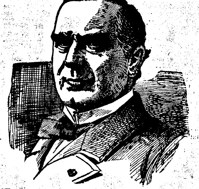
WILLIAM MCKINLEY. Candidat à la Présidence des Etats-Unis.