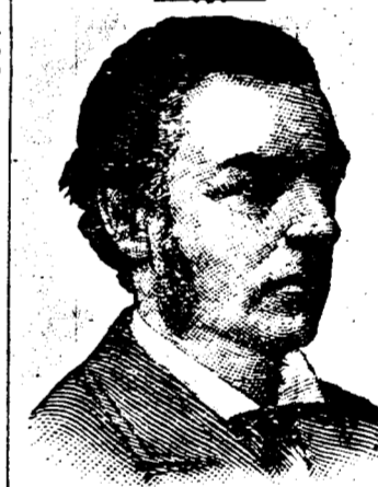
M. JOSEPH CHAMBERLAIN. Le ministre et Mme Chamberlain en route pour les Etats-Unis.

Liverpool, 27 août.—Le ministre des Colonies d'Angleterre et Mme Chamberlain se sont embarqués pour New York sur le Tontonic.