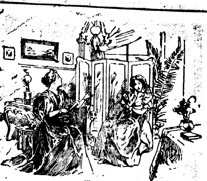
Petit dialogue féminin:

—Oui, ma chère, Mme de Vipérine vous prête ce vilain de faut. —Elle me le prête! Elle veut dire que je le lui emprunte.