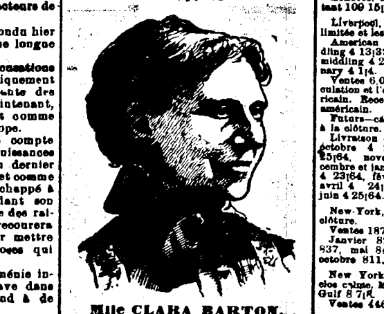
Miss CLARA BARTON.