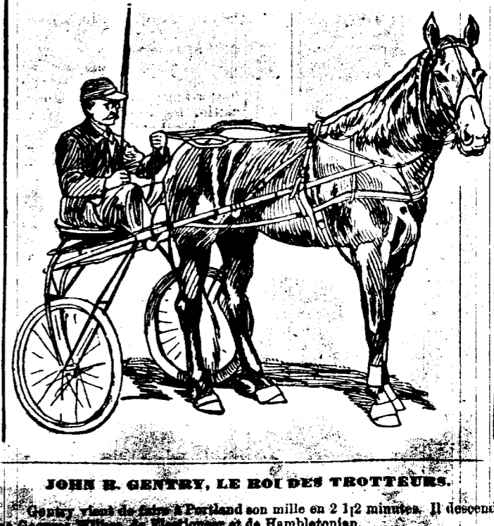
JOHN B. GENTRY, LE ROI DES TROTTEURS.