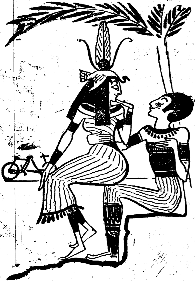
Scor Cher makeh love to the fath

SIBS AND WALLS OF BOOR CHEER. (From an Egyptian cyclo paper.)