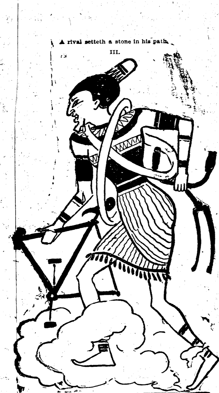
A rival setteth a stone in his path.