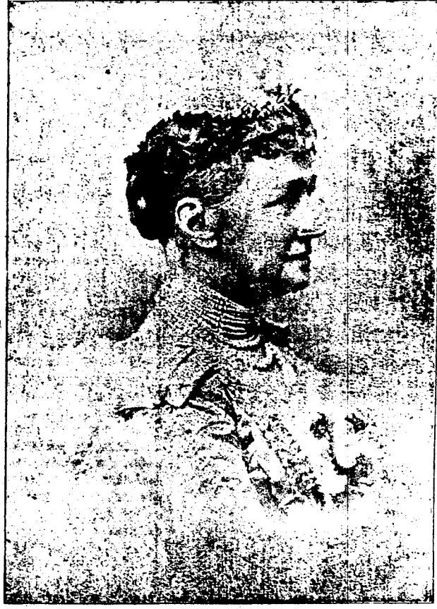
LOUISE WILHELMINE JULIE, REINE DE DANEMARK.