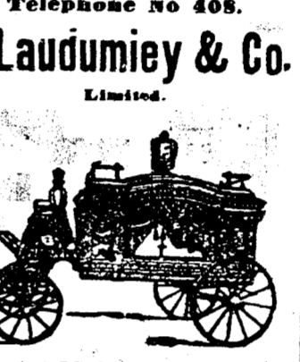
F. Laudumiey & Co. Limited.