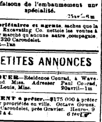
Pompes Funèbres 1128 Nord Remparts.