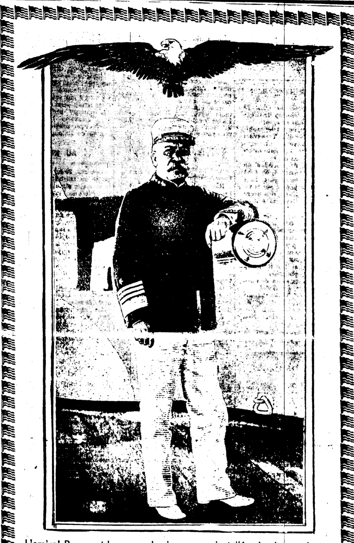
L'Amiral Dewey et le canon de cinq pouces installé près de sa cabine.

New York, 29 septembre.—A une heure précise l'escadre s'est ébranlée. Ce fut un moment émotionnant quand la grande parade navale devint enfin une réalité. En tête s'avancait le bateau de