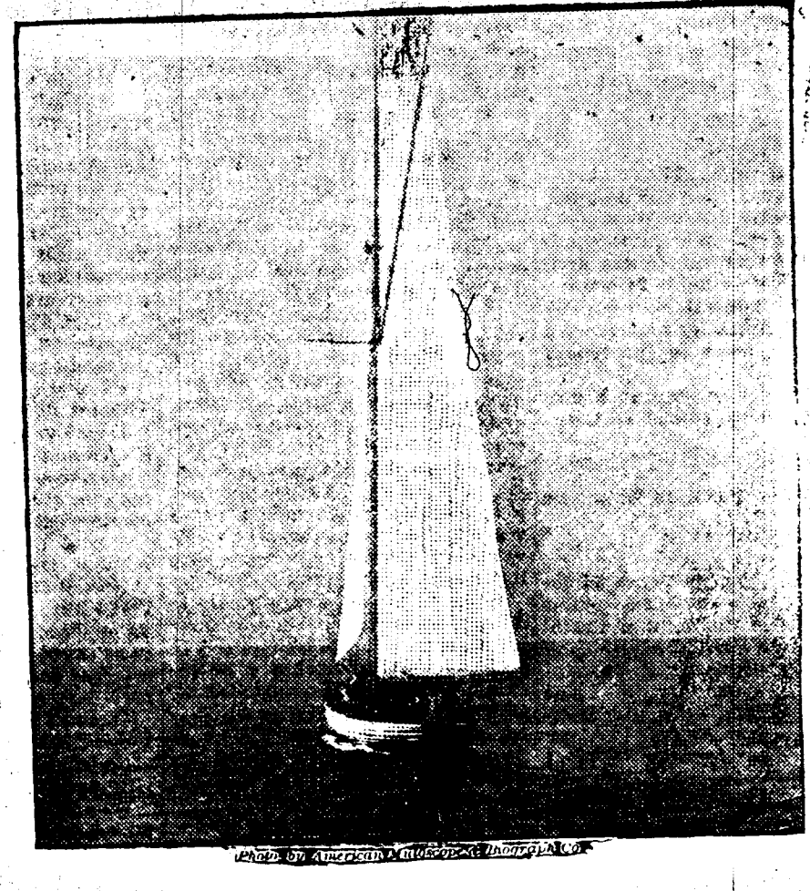
Le "Shamrock" louchoyant dans la seconde course qu'il a perdue avec le "Columbia".

magasin à Ingogo a été pillé par les Boers. Il les a vu entrer à Newcastle, dimanche soir. Il a vu l'avant-garde du général Joubert pénétrer dans la station de Dannheuser, qui est au sud de Newcastle.