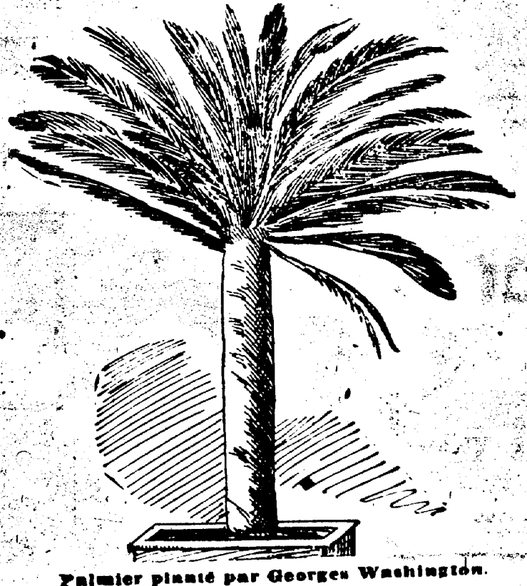
Palmier planté par Georges Washington.

Philip Werlein, Ltd 614-616 RUE DU CANAL, Nouvelle-Orléans.