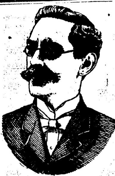
Le Juge Chrétien.