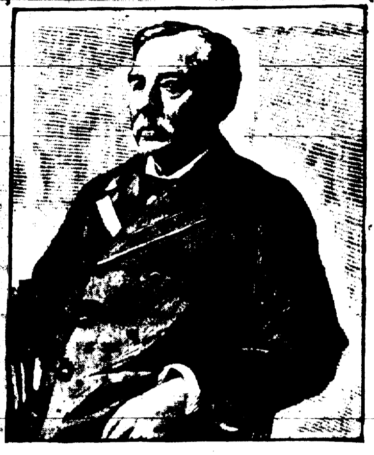
WILLIAM F. FRYE, Sénateur des Etats-Unis, ancien président pro tem de l'assemblée.

qui fond soixante-quinze millions de dollars... Elle se joue de la parole et du bouclier du guerrier et se rit des précautions suggérées par la science.