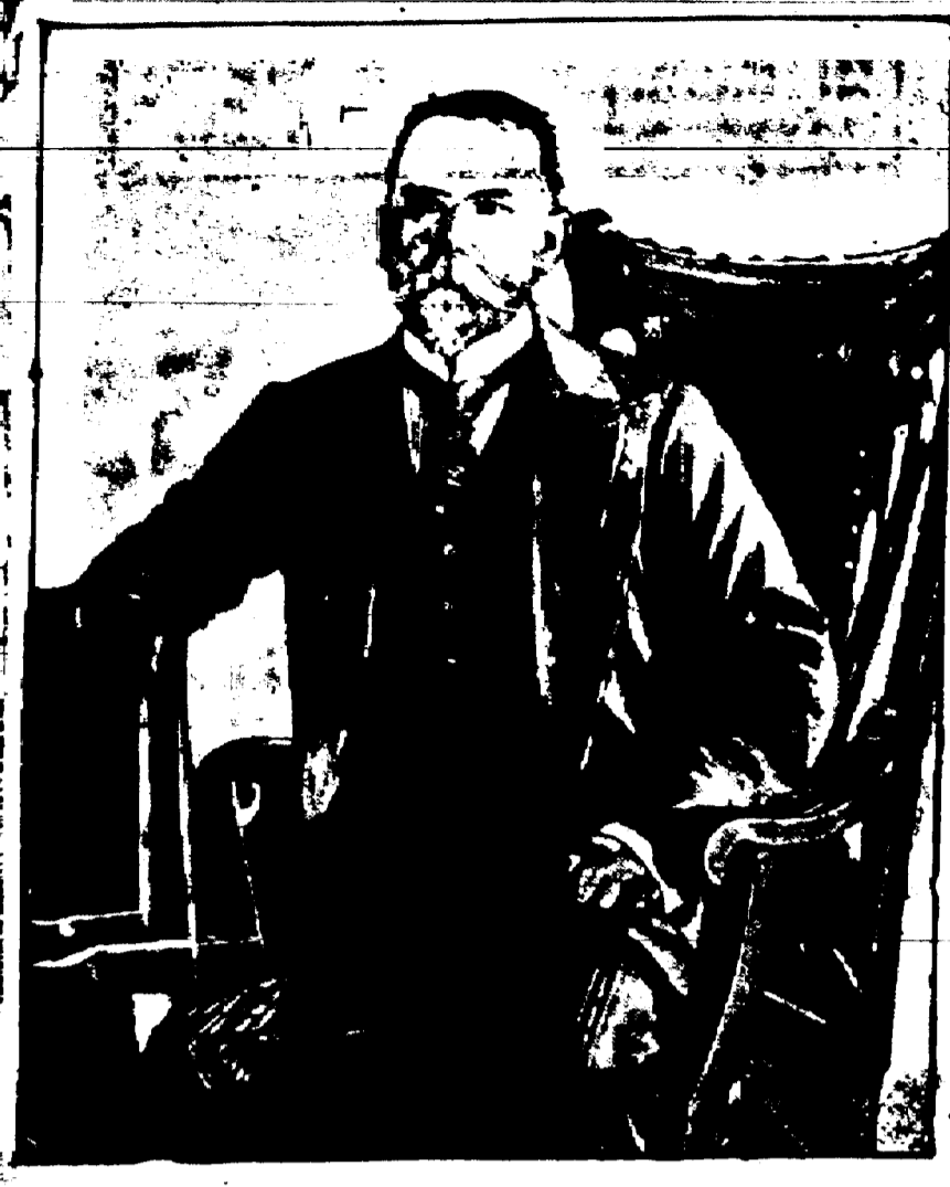
JOHN HAY, Secrétaire d'Etat.

qui fond soixante-quinze millions de dollars... Elle se joue de la parole et du bouclier du guerrier et se rit des précautions suggérées par la science.