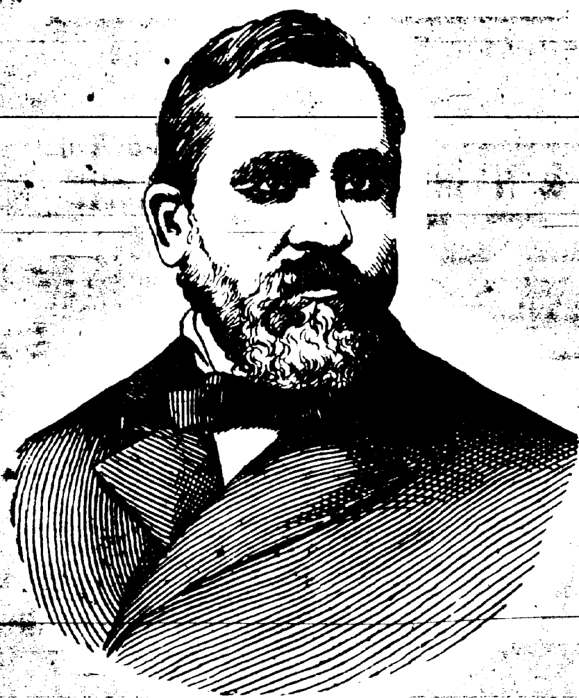
M. ÉMILE LOUBET, Président de la République Française.