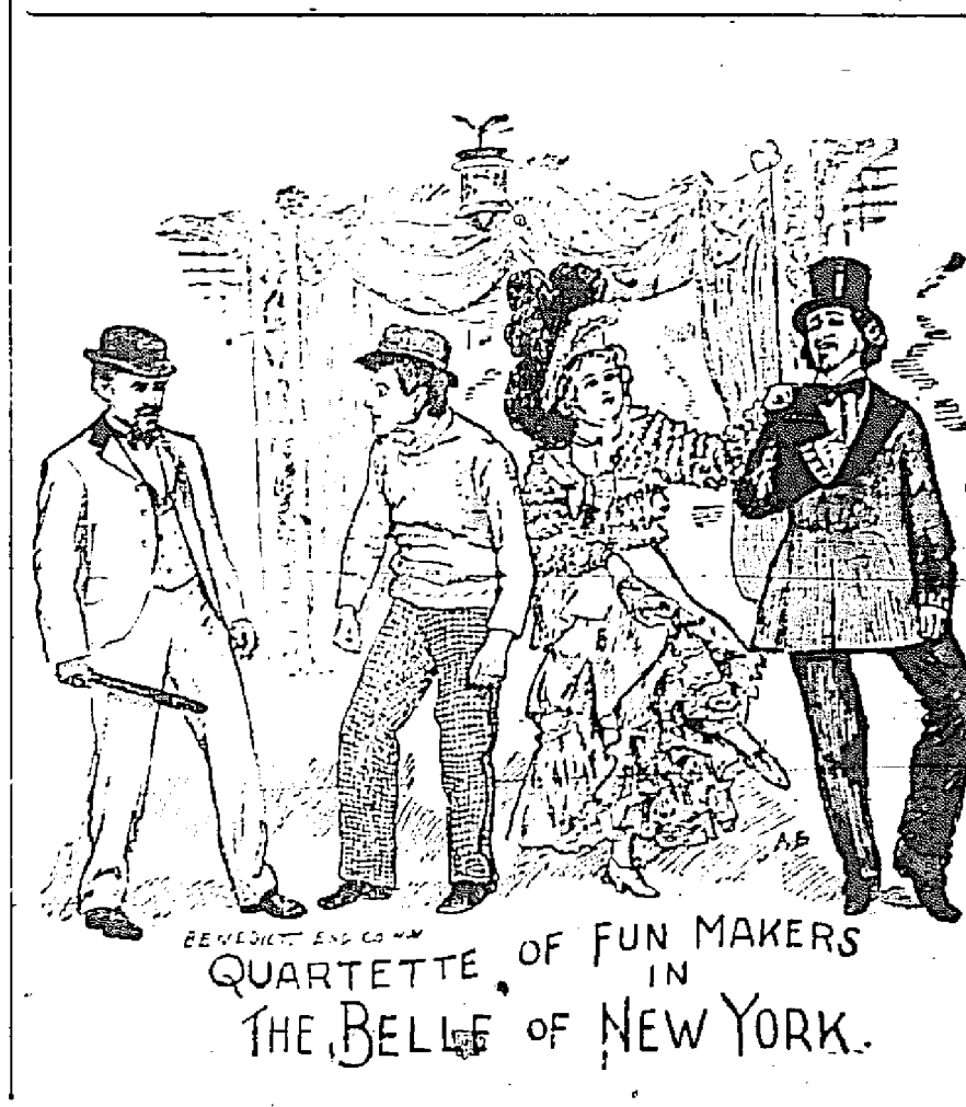
QUARTETTE OF FUN MAKERS IN THE BELLE OF NEW YORK.

Le Verseau (du 22 janvier au 21 février). - Symbole de l'attribution et de la protection, ce signe zodiacal confère, à l'homme ou à la femme qui l'ont à l'ascendant de leur horoscope, avec des chances de fortune dans la seconde moitié de leur existence, de terribles hostilités à vaincre dans la jeunesse et jusqu'à l'âge de 25 ans.