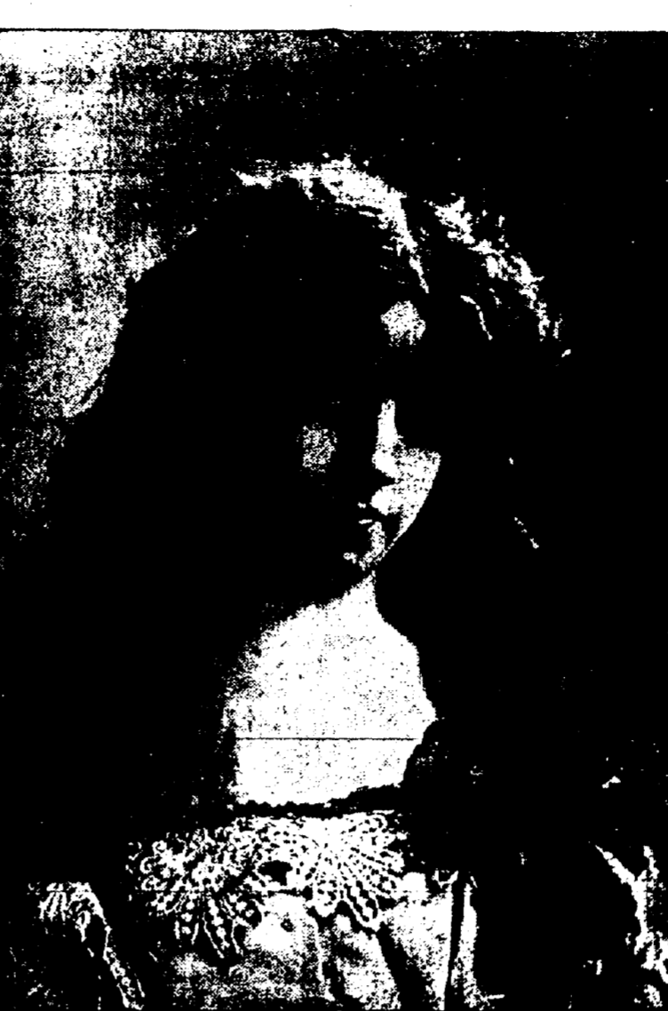
'THE GIRL WITH THE AUBURN HAIR.' à l'Opéra.