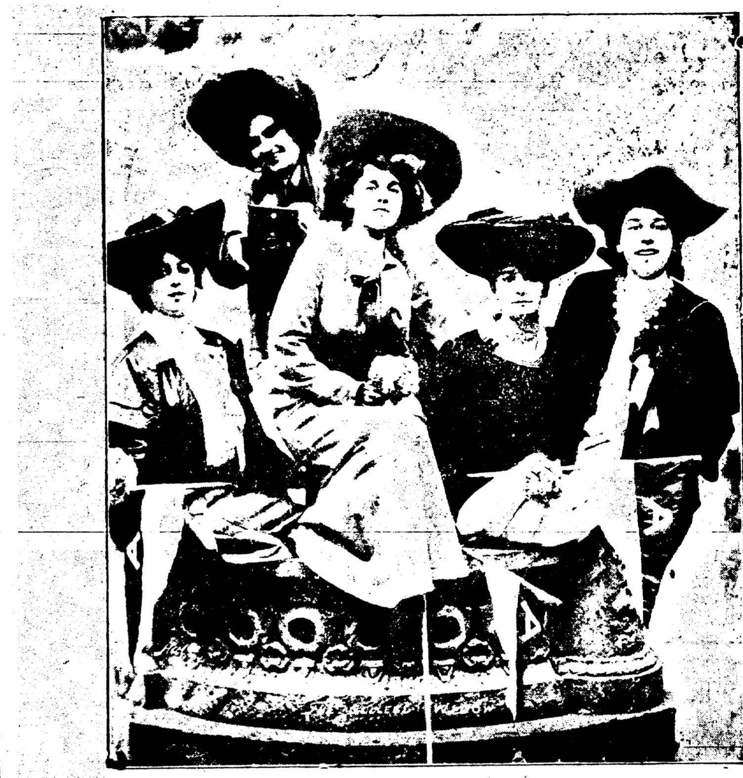
GRUPE DU "COLLEGE WIDOW" AU THEATRE TULANE.