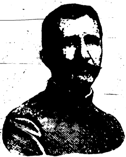
Le Col. C. PICQUART.

Paris, 12 juillet.—La Cour Suprême, dans sa décision rendue publique aujourd'hui, annule l'arrêt de Dreyfus sans nouveau jugement. Cette décision aura pour effet de complètement réhabiliter le capitaine Dreyfus et lui permettra de reprendre son grade dans l'armée comme s'il n'avait jamais été accusé.