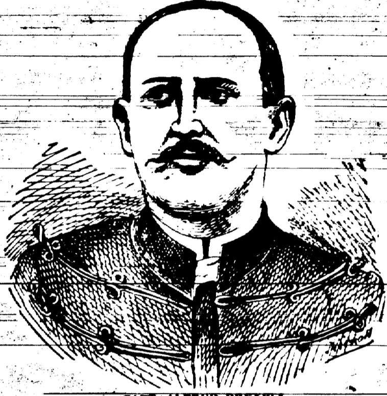
CAPT. ALFRED DREYFUS.

occupait un poste important dans les bureaux du ministère de la guerre, étudia tous les documents relatifs à l'affaire Dreyfus et se convainquit bientôt qu'il y avait eu une erreur judiciaire et que le véritable coupable était le major comte Esterhazy. A partir de ce moment, le colonel résolut de faire rendre justice au capitaine et devint l'un de ses plus fervents défenseurs.