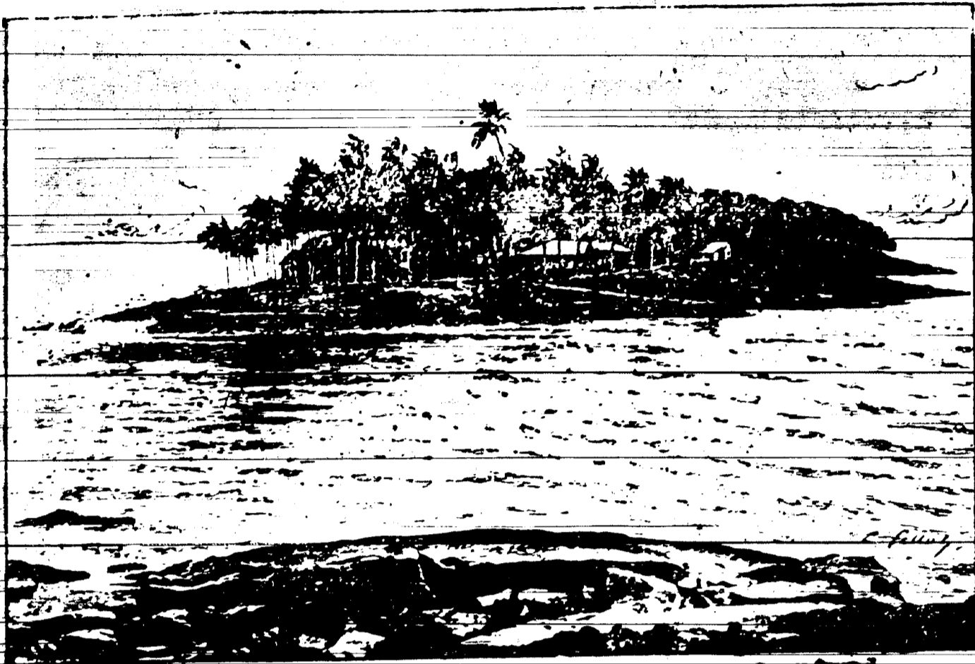
Ile du Diable