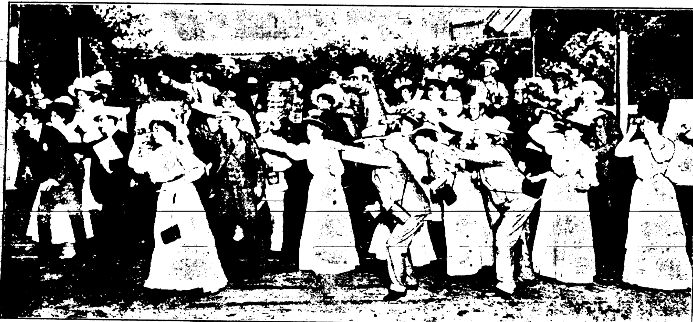
SCENE DU "FUTURITY WINNER", Qui, dit-on, est le vaudeville le plus merveilleux qui soit, et qui est au nouveau programme de l'Orpheum.