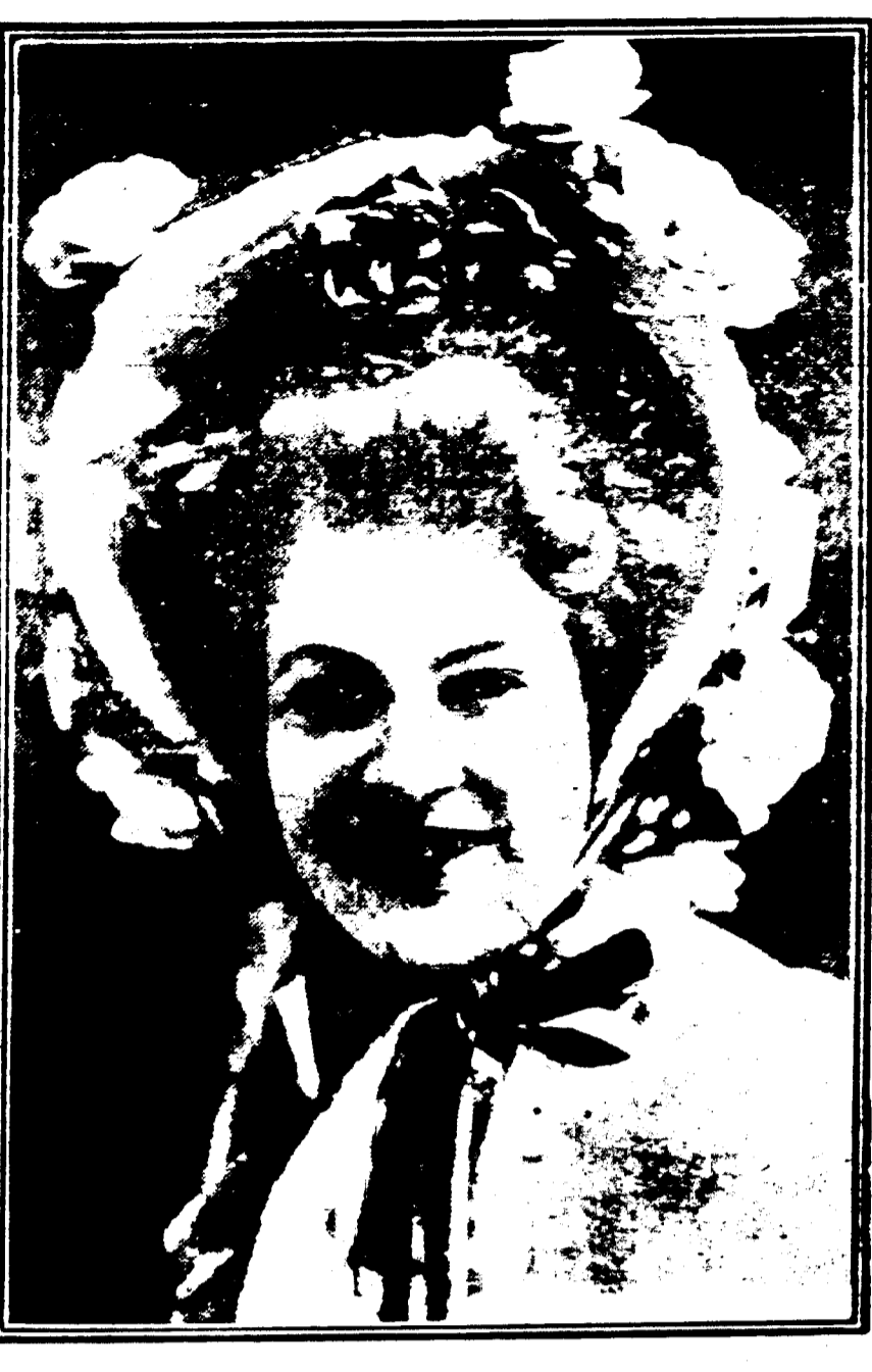
Mme. LA MORRISINE A L'ORPHEUM.