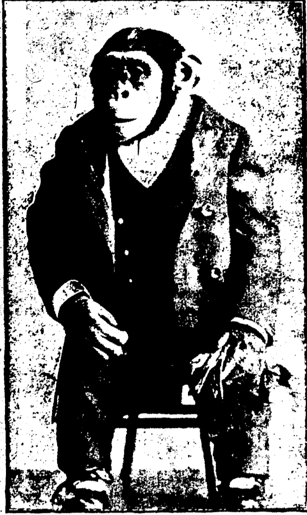
CHARLES I., Le singe presque humain qui paraîtra lundi à l'O-pheum.