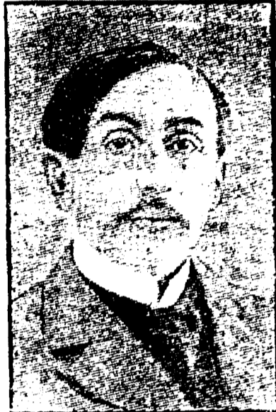
M. MAURICE BARRÈS.

Les principaux désordres de la journée ont éclaté dans les villes de Chambon et d'Eraville. A Chambon la populace a pillé et mis le feu à l'Hôtel de Ville où étaient déposés les urnes électoraux. Les gendarmes accourus pour rétablir l'ordre ont été attaqués et ont dû battre une retraite précipitée sous les cailloux et les projectiles de toute nature que faisaient pleuvoir sur eux les manifestants.