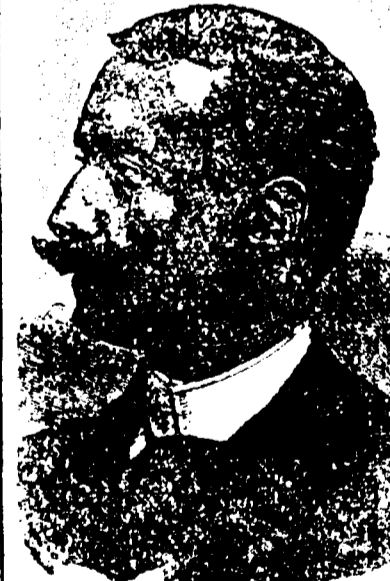
M. PAUL DESCHANÈL.