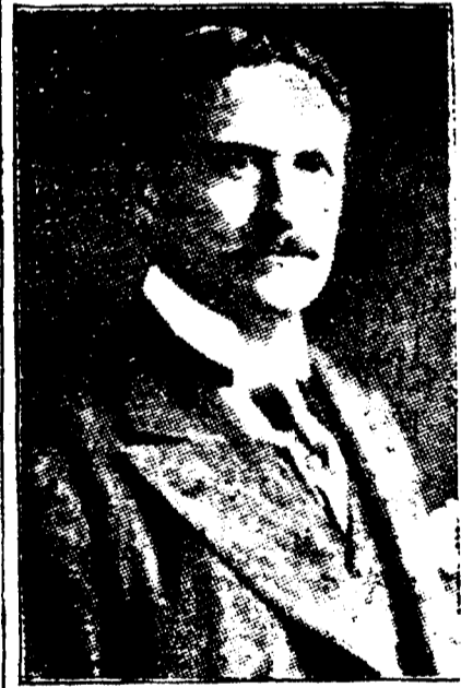
M. BACON, Ambassadeur des Etats-Unis à Paris.

Paris, 25 avril.—L'ex-président a passé un dimanche relativement calme. Accompagné de l'ambassadeur Bacon il s'est rendu dans la matinée à l'Eglise américaine de la rue de Bercy où il a entendu le sermon du Rev. Chauncey W. Goodrich, qui avait pris pour texte l'évangile de St Jean, Chapitre 17.