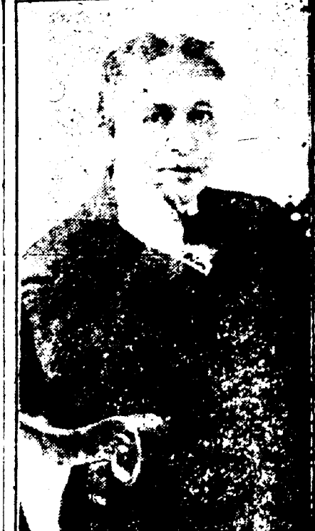
OTIS SKINNER, AU TULANE.

Crippen, a dit le juge, est indubitablement un menteur et a mené une vie immorale, cependant il ne peut pas être condamné sur ce fait.