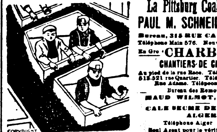
23 oct - 10m - sur vos dies

PAR M. N. J. GIES, Escalier - No 2626 Avenue de la République, No 2626