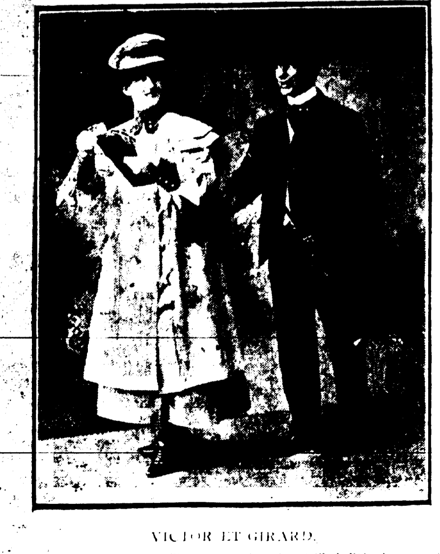
Dans la comédie 'The Stage Struck Girl', à l'Orpheum.