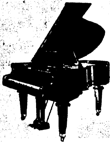
5 pieds Grand, $675 comptant. 5 pieds 7 pouces Grand, $725 comptant. 6 pieds 5 pouces Grand, $800 comptant. Conditions—$25 par mois, 6 pour cent ar. ann.