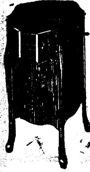
Victrola XI, 12 Records. Prix $109.

Conditions—Un quart comptant, le solde en six paiements mensuels égaux.