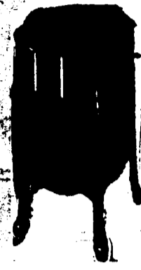
Victrola X, 10 Records. Prix $82.50.

Conditions—Un quart comptant, le solde en six paiements mensuels égaux.