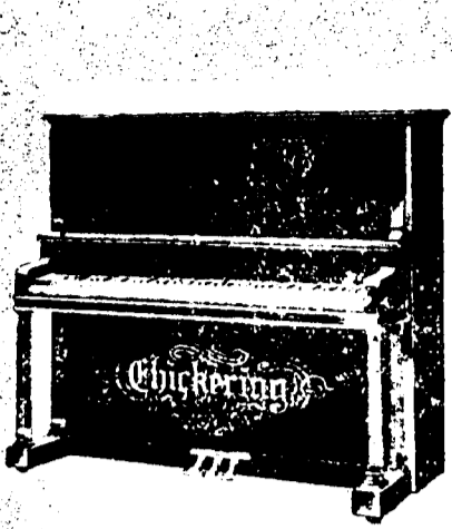
4 pieds 2 pouces droit, $500 comptant. Conditions—$12 par mois, 6 pour cent ar. ann. 4 pieds 6 pouces droit, $550 comptant. Conditions—$12.50 par mois, 6 pour cent ar. ann.