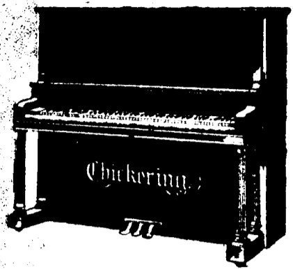
4 pieds 2 pouces droit, $500 comptant. Conditions—$12 par mois, 6 pour cent arajou. 4 pieds 6 pouces droit, $550 comptant. Conditions—$12.50 par mois, 6 pour cent arajou.