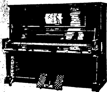
STEINWAY PIANOLA PIANOS, $1,250. Conditions—$30 par mois, 6 pour cent arajou.