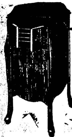
Victrola XI, 12 Records. Prix $109. Conditions—Un quart comptant, le solde en six paiements mensuels égaux.