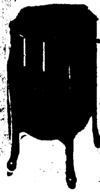
Victrola X, 10 Records. Prix $82.50. Conditions—Un quart comptant, le solde en six paiements mensuels égaux.