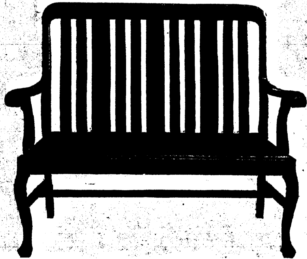
Nos bénéfices, 10 sous par dollar et jamais plus

Parce que nous en vendons de grandes quantités. Voici la réponse. Nous préférons faire un bénéfice plus réduit — et vous serez d'accord avec nous que 10 sous par dollar, c'est peu gagner — et continuer à faire une grande quantité d'affaires. Et c'est là le tout en peu de mots: grosses ventes et petits bénéfices.