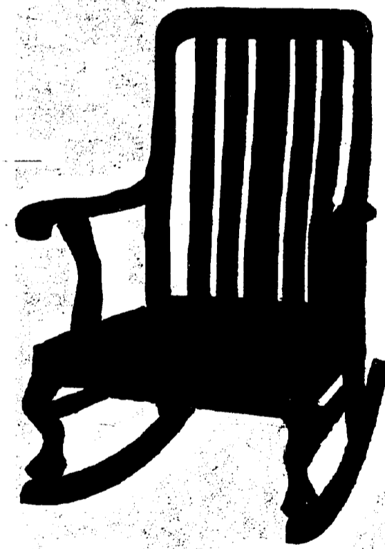
10 Sous par Piastre

Cette série consiste en un Fauteuil à bascule, une chaise et un canapé double. Rappelez-vous, c'est de l'acajou, d'un style élégant, fortement poli et d'un fini tout spécial. En l'achetant de la façon ordinaire, elle coûterait $30.00. Cette semaine seulement, cependant, nous les vendons à..... $18.25