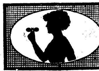
WEAR THE ROBERT... OFFICIER 205, 207 rue Carondelet 7086-1123