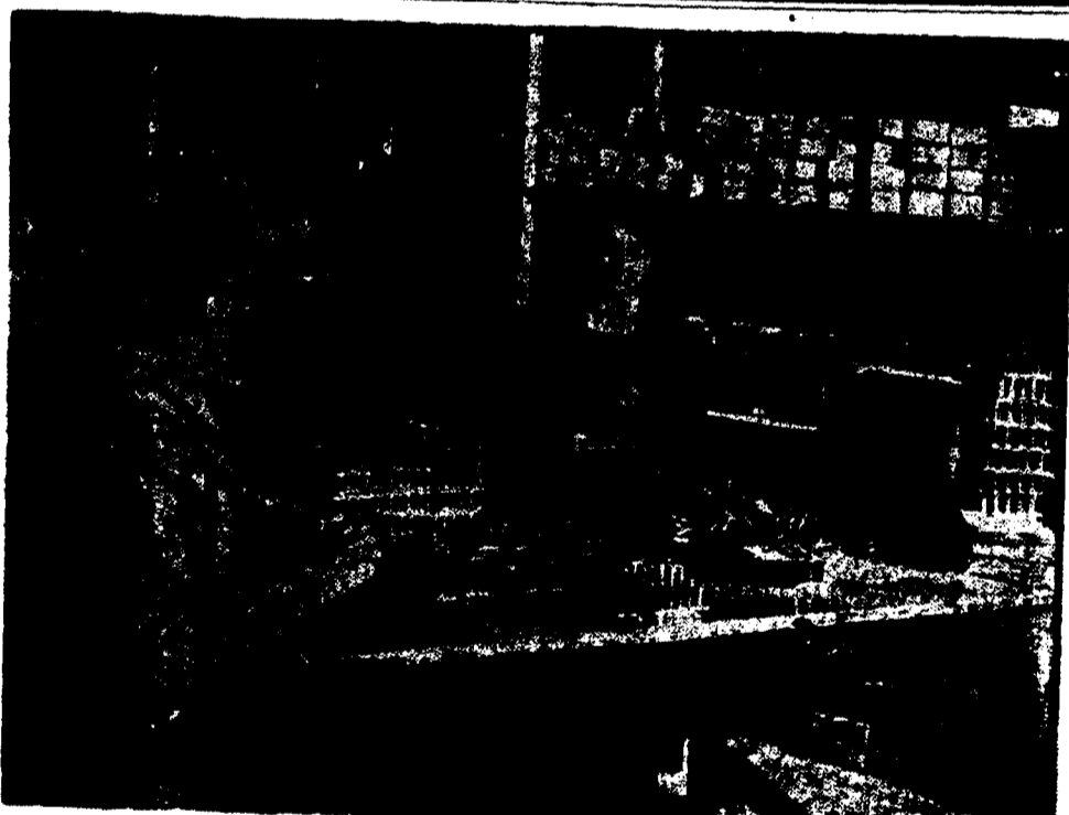
LES PETITES MAINS FONT DES CARTOUCHES

LIVRAISON IMMEDIATE; TELEPHONE, Jackson 1000-1001