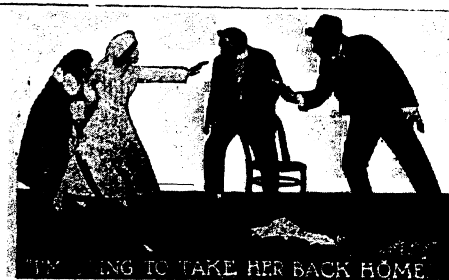
"MILLIONAIRE'S SON AND THE SHOP GIRL" AU CRESCENT.

Orchestre de Concert de l'Orpheum L. E. Jossé, Directeur.