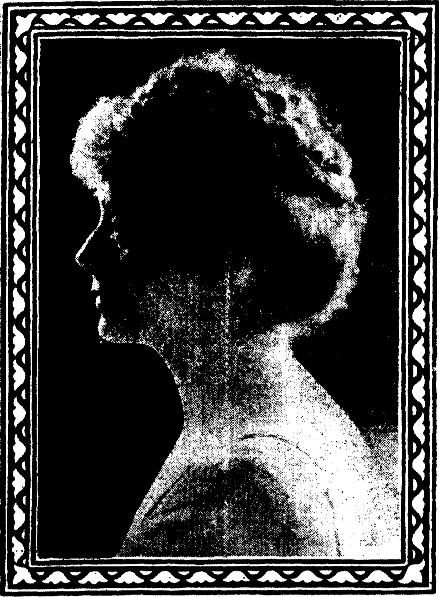
Mlle MAUDE ADAMS

Dans "The Little Minister" au Tulane la semaine prochaine. Commençant Lundi.