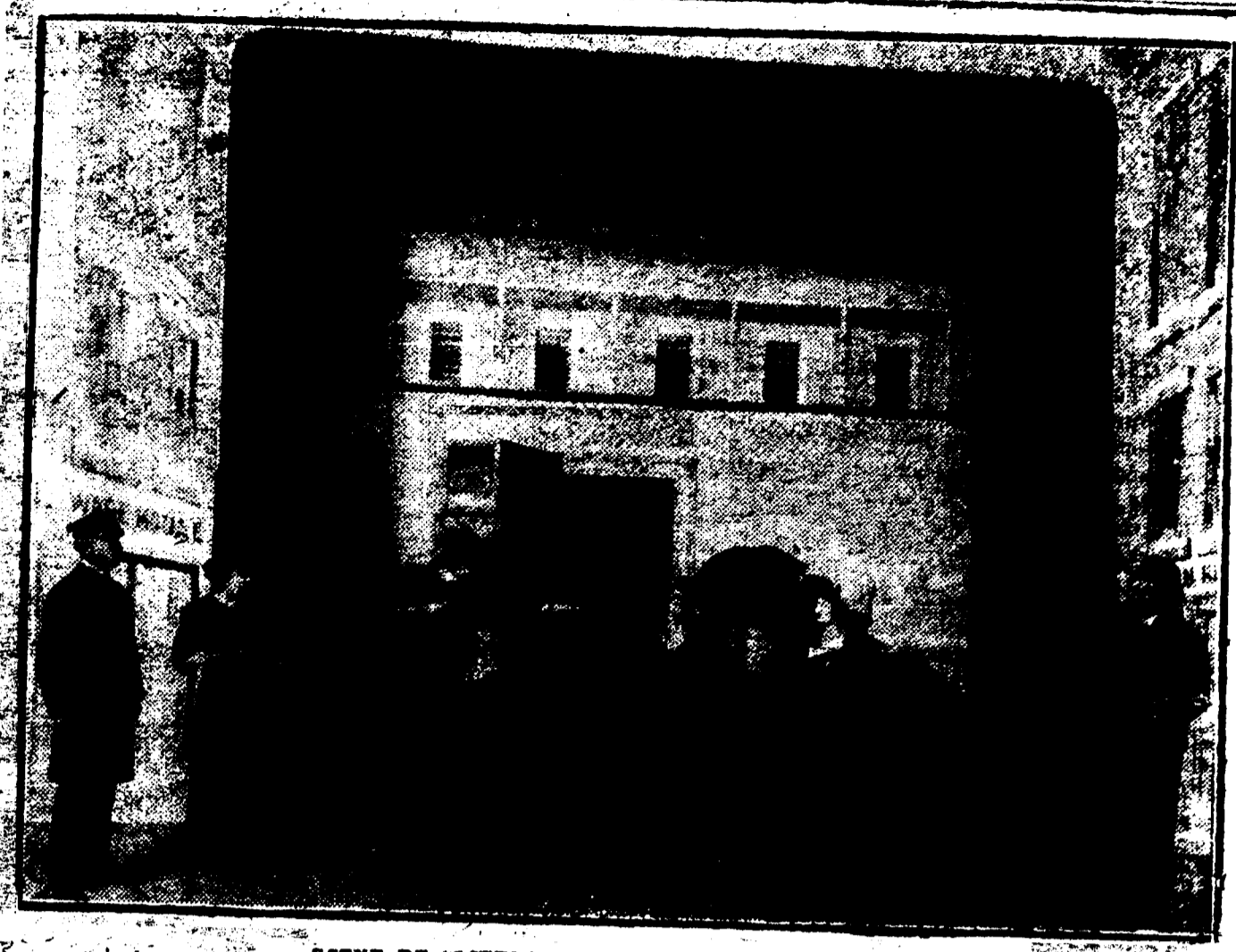
SCENE DE "LITTLE GIRL IN A BIG CITY" AU CRESCENT.

Dans la "Correspondance américaine" de la Bibliothèque Universelle de Lausanne, nous trouvons des détails très intéressants sur l'industrie des scénarios de films aux Etats-Unis, industrie qui a pris une extension extraordinaire. Le Rédacteur l'échoue des sommes très élevées, pour un travail peu fait, et qui est rempli à peine une feuille de papier écrit. Le montant payé à un novice pour un scénario de cette espèce est dix dollars, ou environ $2 francs. Pour un collaborateur attitré des "film companies" cette somme est évidemment dérisoire. Et la consommation des pièces est si formidable que les auteurs peuvent difficilement suffire à la demande. Il s'est formé des cours par correspondance, enseignant à l'écrire des scénarios de pièces d'après les formules reçues. On voit ici des avocats, des médecins, des négociants, débarrasser leur profession pour se lancer dans l'ala du cinématographe, comme leurs prédécesseurs le firent au temps de la fièvre de l'or, pour se précipiter vers la Californie ou l'Alaska. En ce qui concerne la loi de l'offre et de la demande, c'est assurément le monde entier qui est spectacle d'une pénurie d'auteurs dramatiques. Au point de vue de l'art proprement dit, on a droit à gâcher.