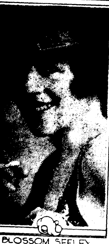
BLOSSOM SEELEY OPHEUM